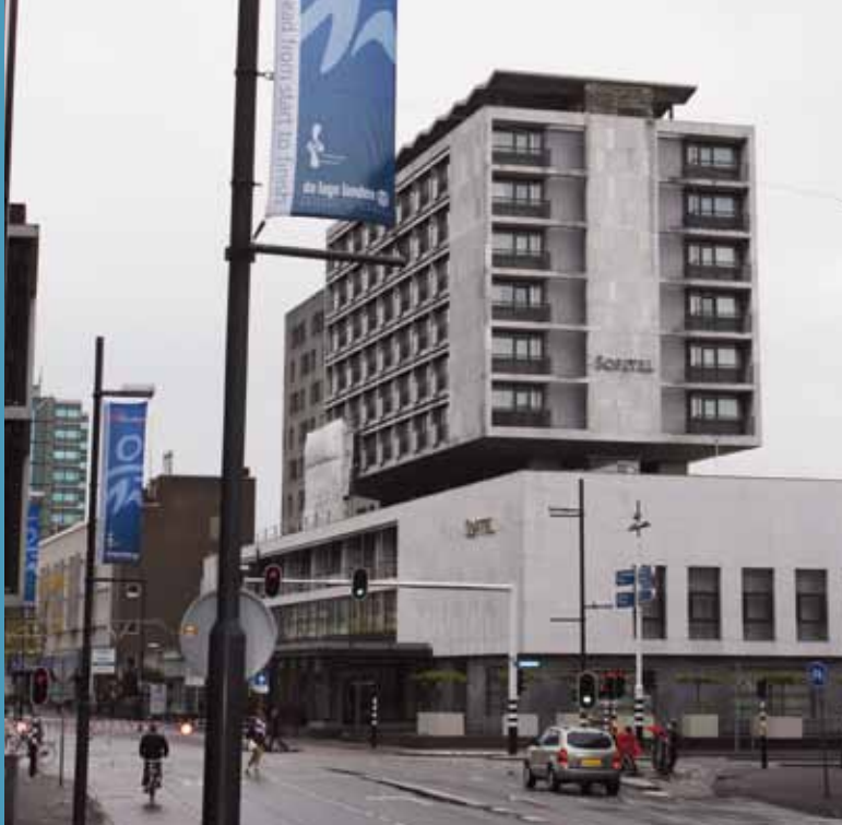
Sofitel Cocagne in Eindhoven